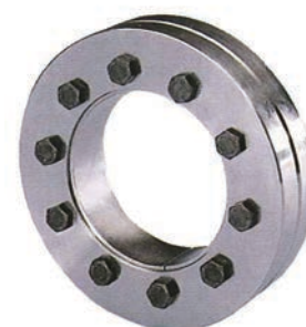
Klassisk krympeskive i 3-delt design

Ts (Nm) = Boltspændingsmoment T (Nm) / F (kN) = Overførbart drejningsmoment eller aksial kraft ved tilspændingsmoment Ts